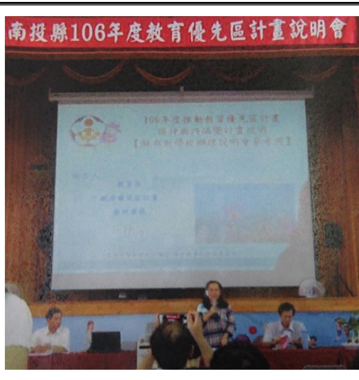
內容：教育優先區說明及檢討