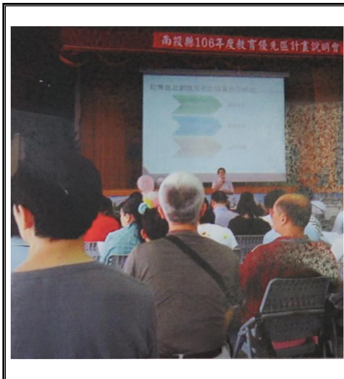
內容：參加教育優先區說明會