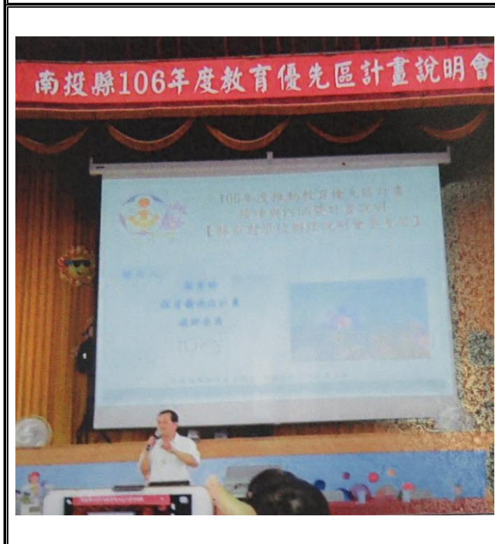
內容：參加教育優先區說明會