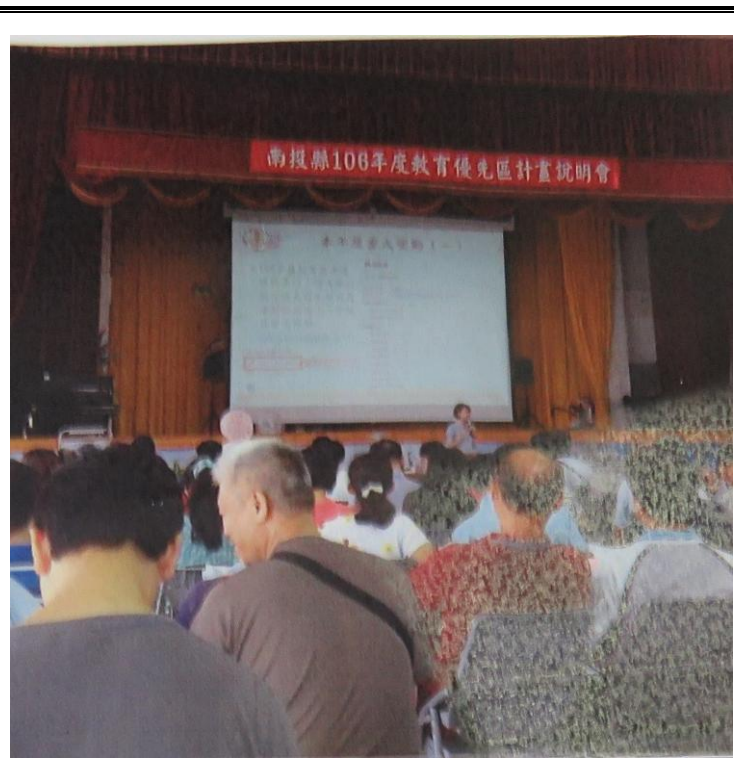
內容：參加教育優先區說明會